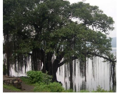
జాతీయ వృక్షం - మర్రి చెట్టు