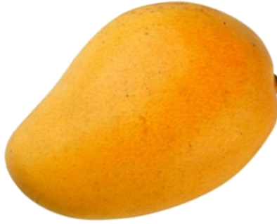
జాతీయ పండు మామిడి