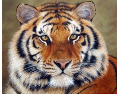
జాతీయ జంతువు - పెద్ద పులి