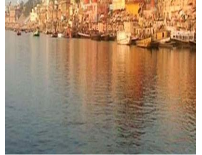
జాతీయ నది - గంగా నది