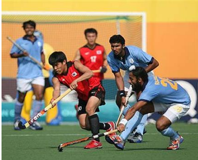
జాతీయ క్రీడ - హాకీ