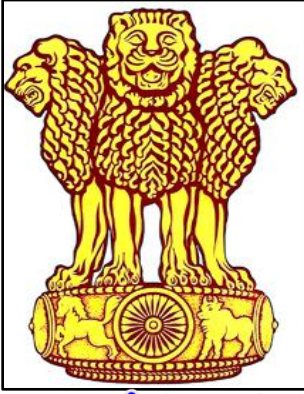
జాతీయ రాజ ముద్ర నాలుగు ముఖాల సింహం