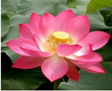
జాతీయ పుష్పం - తామర