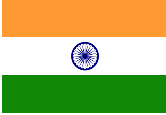
జాతీయ జెండా - త్రివర్ణ పతాకం