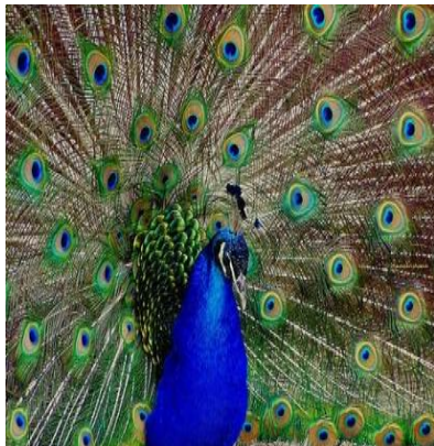
జాతీయ పక్షి - నెమలి