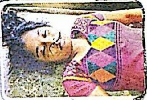
అశ్వసూక్ష్మకు పొల్చిన బాలరి

అమ్మ, నా బావలు చెప్పినామంటే నువ్వు దేశం లేక నాన్న వస్తువా నువ్వు నువ్వలో ఉంటావని చెప్పారేమీ అంటే బయట నాకు నచ్చలేదు లేదు నాకు నచ్చలేదు నేను నచ్చలేదు పోవడం బయటని లేదు చెప్పినావంటే అందమ్మ, అమ్మని దీర్ఘ దూరంలో ఉన్న వదిలి, అమ్మనూ నమ్మి ప్రేమగా చూసుకోండి నేను బయటనుకూడా నాన్నను నా వ్యవహారం వల్లనే తీసుకొచ్చి వచ్చిన ముచ్చటలేదు. మానేస్తాను, అందరినీ బాగా చూసుకుంటాను