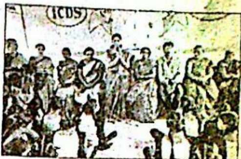
బాల్యవివాహాల బయటకు తీసుకువచ్చే కుటుంబాలకు పురస్కారాలు పంపిణీ చేసే కార్యక్రమం.

కర్ణాటక, మైసూరు: కర్ణాటకలో జరిగిన బాల్య వివాహాల బయటకు తీసుకువచ్చే కుటుంబాలు పురస్కారాలను పొందడం కోసం కర్ణాటక, విద్యార్థులను సహజంగా పాఠశాలలో ప్రవేశపెట్టడానికి ప్రయత్నిస్తున్నారు.